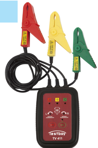
TV411 E-No 980 125 129