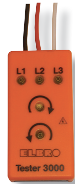
TESTER 3000 E-No 980 125 419